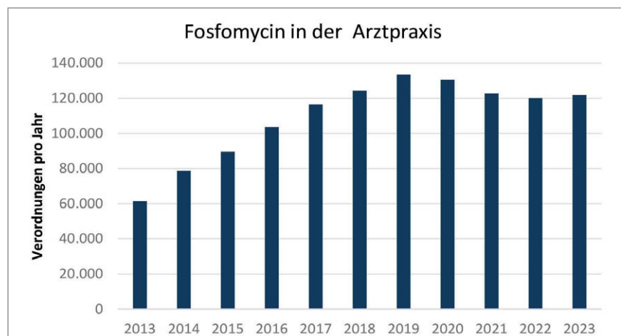
Abb. 1: Verordnungen (VO) bzw. Arzneimittelrezepte (ausgenommen zahnärztliche Verordnungen) in Hessen, die von den Versicherten der gesetzlichen Krankenversicherung (GKV) in Apotheken eingelöst und gemäß § 300 Abs. 2 SGB V erfasst wurden. (Daten von Firma Insight Health GmbH & Co. KG, Waldems-Esch, für die Kassenärztlichen Vereinigung Hessen zur Verfügung gestellt).

Aber: oral eingenommen wird nur in den ableitenden Harnwegen eine therapeutisch wirksame Konzentration erreicht. Infektionen anderer Organe können mit Fosfomycin oral nicht therapiert werden, da wirksame Plasma- oder Gewebespiegel nach p. o.-Gabe nicht erreicht werden [11].